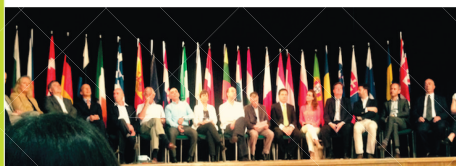
Celebración del día de Europa en el Campus Universitario