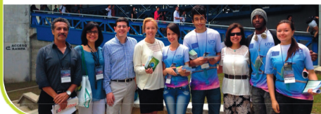
Diplomado Internacional Gestión Integral Guadua Misión Académica a Francia – octubre de 2015: ENIM – Lorraine, Arts et Métiers, CIRAD