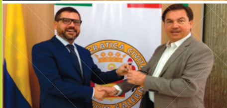
Relacionamiento con la Universidad de Salerno (Italia) para la estructuración de programas académicos de doble titulación