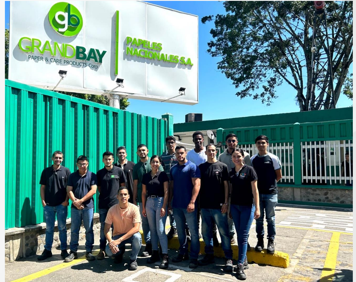
Visita académica estudiantes de IPSM a la empresa Papeles Nacionales