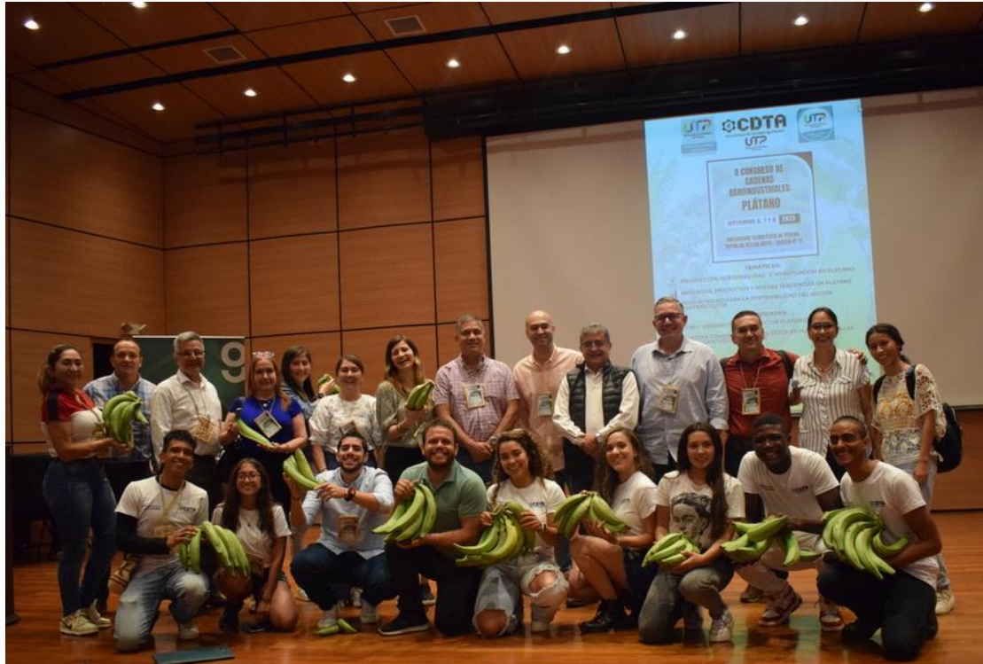
II Congreso de Cadenas Agroindustriales : Plátano