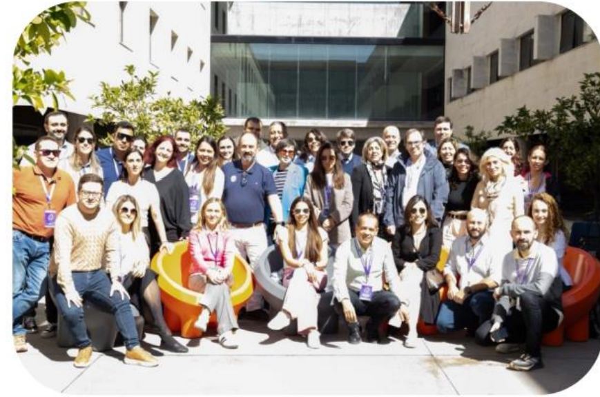
Docentes, Autoridades, Equipos ORIs - SOMOS HUBIO C